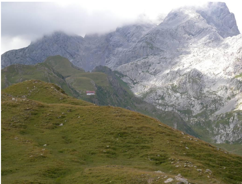
Il Rifugio Marinelli tra i Monti Coglians e Floriz

Fra gli habitat integrati si considera molto positivo il valore dei lariceti primari (9420), mentre i nardeti montani soffrono di uno stato di conservazione non particolarmente favorevole.