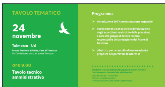
Retro invito tavolo amministrativo