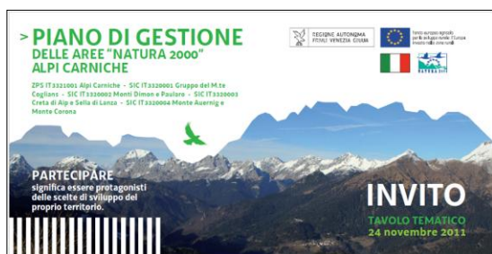
Fronte dell'invito del 24 novembre

Ad ogni singolo portatore di interessi è stato inviato un invito ai tavoli tematici mediante una e-mail o mediante posta ordinaria quando non muniti di un indirizzo di posta elettronica. Sono stati realizzati tanti inviti quanti erano i tavoli, di seguito a titolo esemplificativo riportiamo uno degli inviti, poiché l'impostazione grafica era la medesima per tutti.