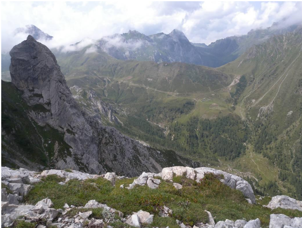
Giogo Veranis visto dal Monte Avanza

Le brughiere occupano porzioni molto significative dell'area mentre le mughete sono piuttosto rare e limitate ad alcuni specifici settori. Anche in questo sito vi sono vaste superfici che a causa dell'abbandono del pascolo stanno subendo fenomeni dinamici che portano all'insediamento delle brughiere o dei consorzi ad alte erbe.