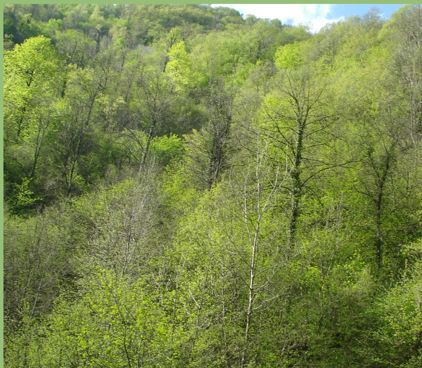
Aceri-Frassineti (Habitat 9180)