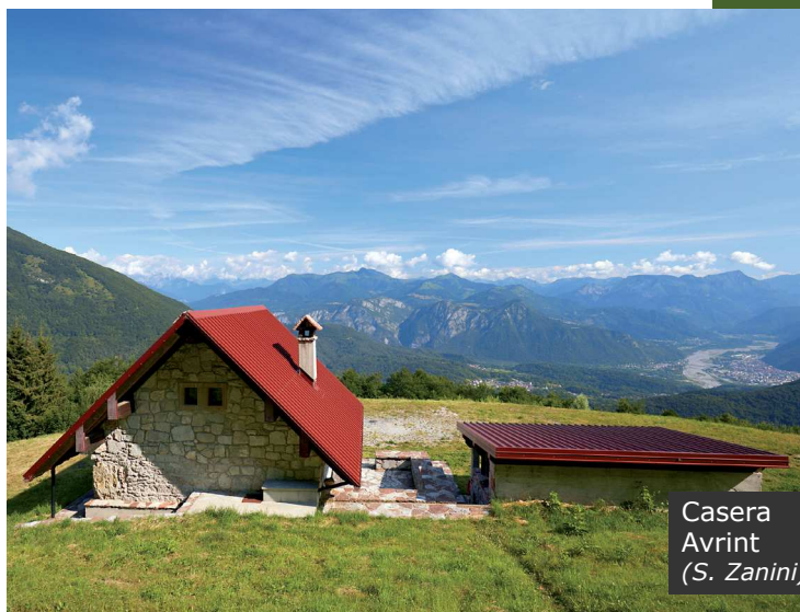
Casera Avrint (S. Zanini)

do ad abbracciare buona parte della catena delle Alpi Carniche e delle Giulie. Uno spettacolo da non perdere è l'alba che illumina pian piano tutte le cime con effetti di luce davvero sorprendenti, specialmente in condizioni di cielo terso. La casera, abbandonata all'i-