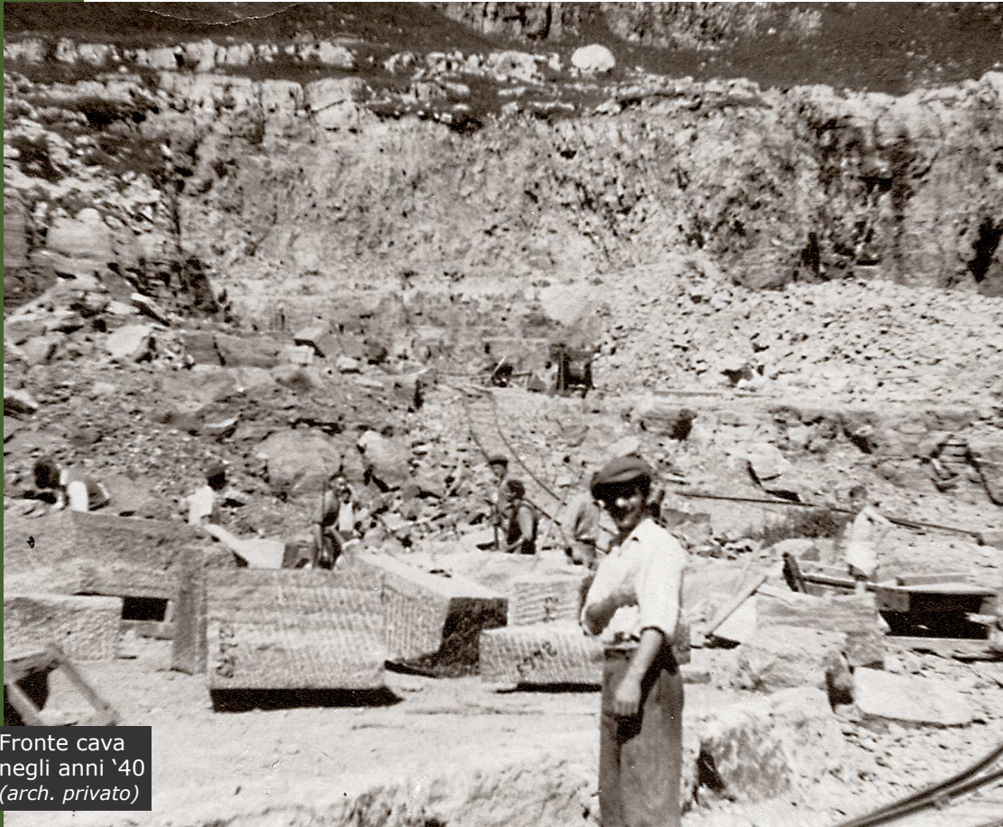
Fronte cava negli anni '40

Variante: esiste una variante che permette di risparmiare una ventina di minuti sia in salita che in discesa. Parcheggiando lungo la S.P. 1 che sale da Verzegnis, nei pressi di Loc. Loida, si scende a sinistra lungo una pista forestale che parte nei pressi di una casa. Raggiunto l'itinerario principale, svoltare a sinistra proseguendo in direzione di Malga Avrint. E' possibile realizzare anche un percorso ad anello, salendo a Casera Avrint da Sella Chianzutan e rientrando lungo la pista di cui sopra ma si deve percorrere un lungo tratto su asfalto in presenza di traffico lungo la S.P. n° 1 della Val d'Arzino (circa 2,5 chilometri).