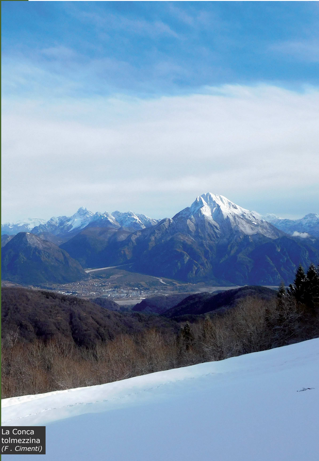
La Conca tolmezzina (F. Cimenti)