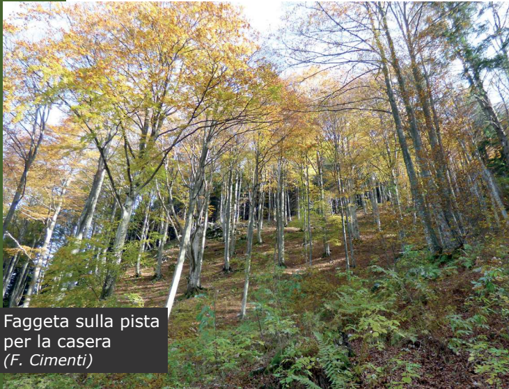
Faggeta sulla pista per la casera

Lasciando l'ampio parcheggio di Sella Chianzutan ci incamminiamo lungo una comoda pista forestale, realizzata recentemente ed in buono stato di manutenzione, che inizia nei pressi del segnavia CAI 811. Poco dopo, al primo tornante, svoltiamo decisamente verso est proseguendo in leggera