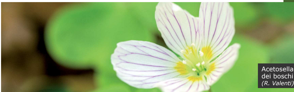
Acetosella dei boschi (R. Valenti)

Raggiungere la ristrutturata e panoramica Casera Avrint riporta ai tempi passati, quando queste zone erano frequentate da tanti valligiani intenti nel duro lavoro quotidiano. Il paesaggio era profondamente diverso rispetto a quello attuale. Le abetaie che si incontrano sono frutto di rimboschimenti artificiali, che oggi si cerca di trasformare in boschi più naturali. Fino agli inizi del secolo scorso tutta l'area era caratterizzata da magnifici prati, alcuni sfalciati ed altri adibiti a pascolo, nei quali risuonavano i caratteristici campanacci delle vacche e le voci squillanti ed allegre delle donne impegnate nella raccolta del fieno. Gli uomini invece erano per lo più impegnati nel duro lavoro di estrazione del marmo rosso della Cava Lavoreit ros . Situata nel gruppo del Monte Verzegnis, la sua coltivazione fu iniziata negli anni Venti e risultò fonte di sostentamento per molte famiglie e, molto spesso, un'alternativa all'emigrazione.