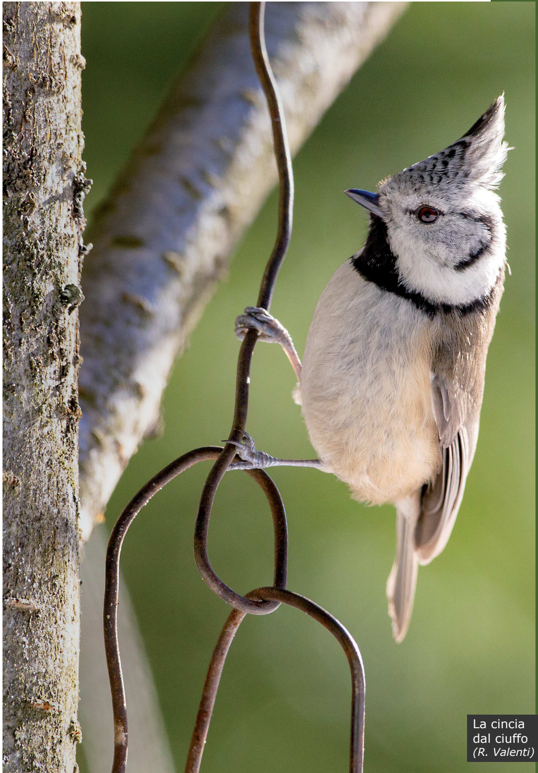
La cincia dal ciuffo ( R. Valenti )