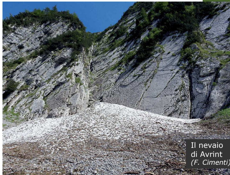
Il nevaio di Avrint

essere effettuato anche in inverno, purché muniti di idonea attrezzatura e qualora le condizioni di sicurezza sotto il profilo della caduta di valanghe lo permettano. A tal proposito, nel tratto finale del percorso ci troviamo ad attraversare un caratteristico