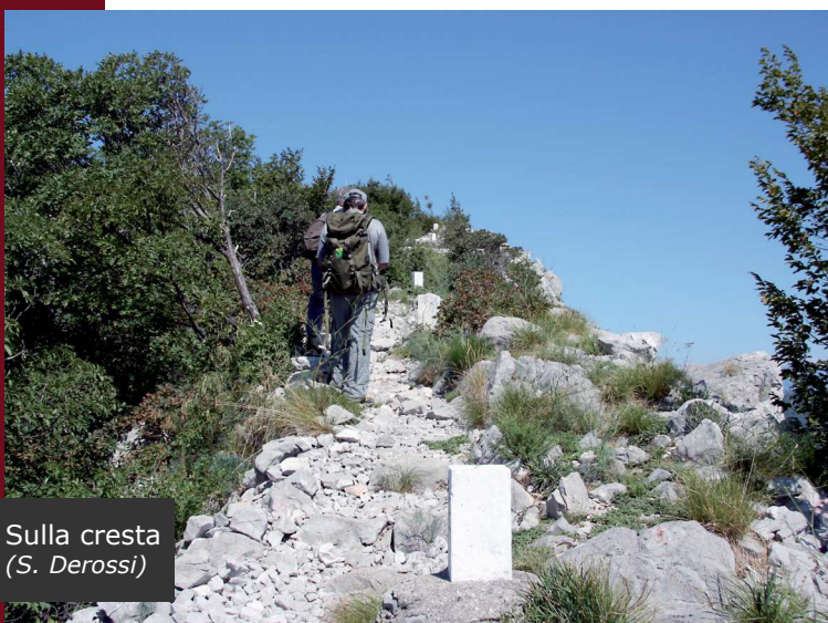
Sulla cresta (S. Derossi)

Dalla strada principale, seguendo i segnavia CAI 97, saliamo verso l'ultima casa, da dove parte un'ex mulattiera in pietrame che risale il Monte Sabotino. Passiamo sopra la strada slovena che collega Nova Gorica al Collio e proseguiamo a destra, in leggera salita tra ginestre, santoregge e ciliegi canini, notando come la massicciata a valle della mulattiera sia ancora ben conservata. Oltrepassiamo la linea di confine, qui segnalata con una piastra a terra numerata 55/10, e proseguiamo seguendo i segni circolari bianco-celesti del Club alpino sloveno. Dopo un tornante il sentiero segnalato svolta a destra, sul versante in direzione dell'eremo di San Valentino. Lasciamo il sentiero e proseguiamo sulla mulattiera per rientrare in territorio italiano (piastra a terra 55/9) e riprendere le tracce del sentiero CAI 97. Dopo un bivio procediamo in leggera salita fino a raggiungere una baita in legno che