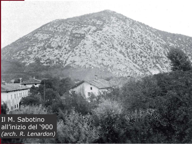
Il M. Sabotino all'inizio del '900 (arch. R. Lenardon)

per i rettili, quali la vipera dal corno, l'algiroide magnifico ed il ramarro occidentale. Sono una cinquantina le specie di uccelli nidificanti, tra cui si evidenziano le presenze dei rapaci diurni come il falco pecchiaiolo, lo sparviere, la poiana, l'aquila reale ed i passaggi