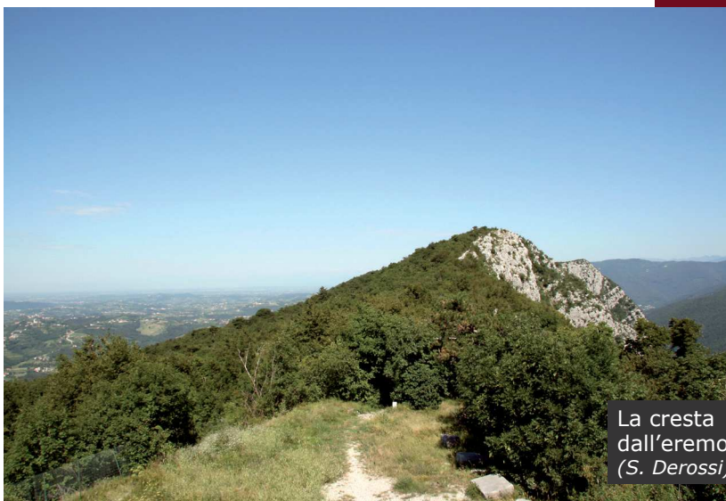
La cresta dall'eremo (S. Derossi)

Con alcuni saliscendi tra vecchie opere militari, caverne attrezzate e linee di trincee, che dominano il dirimpetto Monte Santo, con il suo rinomato San-