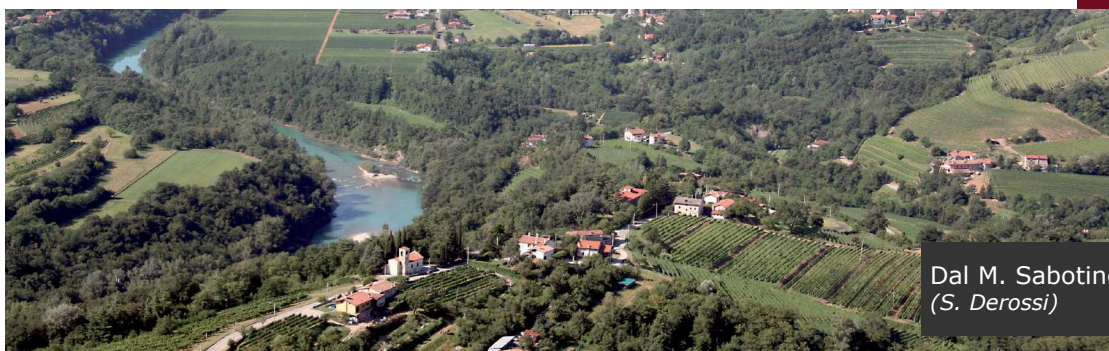
Dal M. Sabotino (S. Derossi)

Il possente rilievo del Monte Sabotino , che troneggia sopra il corso del Fiume Isonzo e sulle città di Gorizia e di Nova Gorica, per la sua particolare posizione geografica e per le peculiarità geomorfologiche e storiche, rappresenta un "unicum" nell'ambito dei rilievi denominati Collio goriziano e sloveno (Goriska Brda), che risultano molto antropizzati. Zona fortificata e contesa durante la Prima guerra mondiale, è stata dichiarata un'area monumentale dal 1922 e poi divisa, dopo la seconda grande guerra, da un rigido confine di Stato tra Italia e Jugoslavia sottoposto a una stretta vigilanza militare che, limitando i transiti, ne ha favorito la naturalità e un lento ritorno del bosco. Nelle aree rimaste più aperte è ancora molto ricca la biodiversità. Con la caduta dei confini e nell'ambito dei progetti di integrazione europea tra Italia e Slovenia il Monte Sabotino si è oggi trasformato in un frequentato " Parco della Pace " internazionale senza confini.