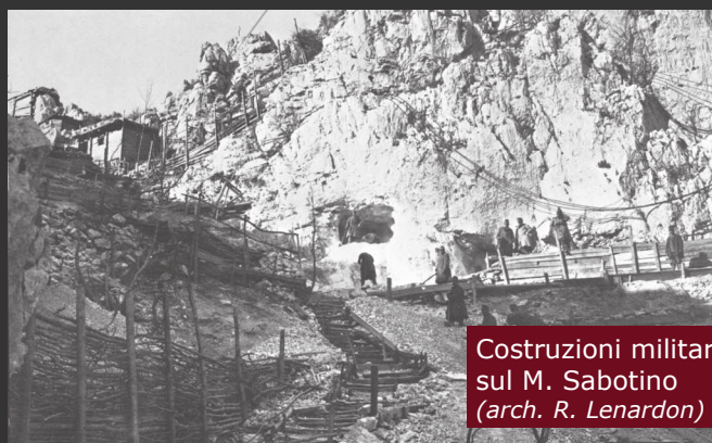
Costruzioni militari sul M. Sabotino ( arch. R. Lenardon )

Durante la Grande Guerra il Monte Sabotino, grazie all'importanza strategica della sua dorsale e della cima, divenne il baluardo austro-ungarico nord per la difesa della testa di ponte di Gorizia. Gli austriaci avevano realizzato un poderoso sistema fortificato sotterraneo, contraddistinto da gallerie poste su più livelli. Dopo alcuni assalti, all'inizio della sesta battaglia dell'Isonzo (6 agosto 1916), il monte venne espugnato dalle truppe italiane ed il giorno successivo cedette la linea austro-ungarica del Podgora, permettendo l'ingresso a Gorizia dei reparti attaccanti (9 agosto 1916). Conquistato il monte, gli italiani scavarono imponenti gallerie in cui vennero posizionate le artiglierie e le cannoniere utilizzate per vincere poi l'undicesima battaglia dell'Isonzo (17 agosto–31 agosto 1917). Con il Regio Decreto n. 1386 del 1922 la sommità del monte divenne un'area monumentale e fu attrezzata come un museo all'aperto, dove tre piramidi in pietra vennero posizionate a rimarcare la linea di partenza dell'attacco italiano che portò alla conquista del monte. Inglobata in gran parte in territorio jugoslavo nel 1947 dopo la Seconda guerra mondiale, una porzione dell'area monumentale in prossimità dell'eremo di San Valentino è ritornata in territorio nazionale con il Trattato di Osimo del 1975.