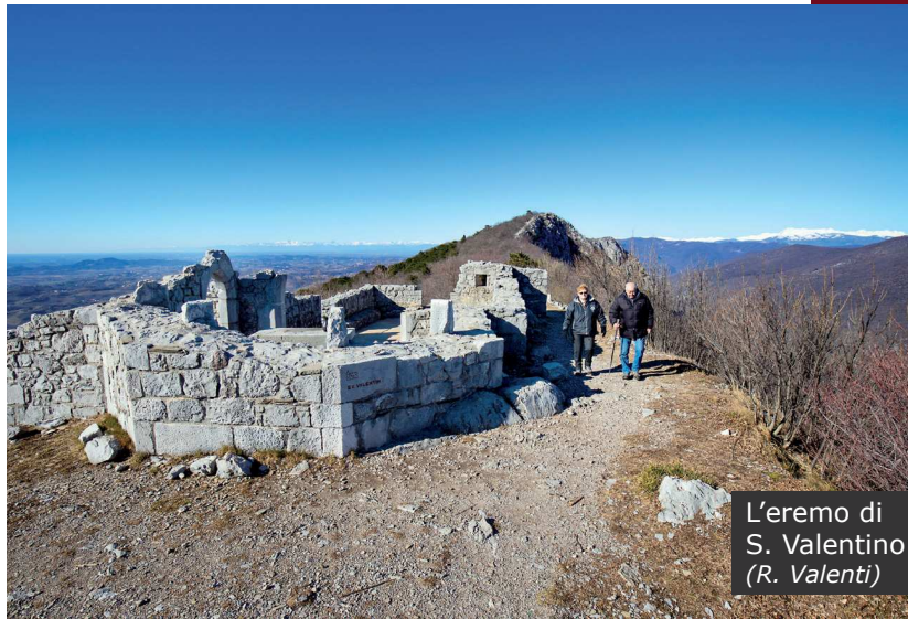
L'eremo di S. Valentino (R. Valenti)

precisamente rientrano nei "Calcari di Aurisina" del Turoniano-Campaniano (da 94 a 72 milioni di anni fa). Proseguiamo oltrepassando una trincea e dopo un piccolo terrapieno la risalita si fa più agevole in boschi più aperti. La vegetazione infatti è caratterizzata da una boscaglia, solo a tratti fitta ed intricata, dominata nella parte più bassa da rovere, cerro e roverella. Salendo di quota prende il sopravvento la boscaglia carsico-illirica, a carpino nero ed orniello, che lascia ampi spazi a praterie aride e al pino nero.