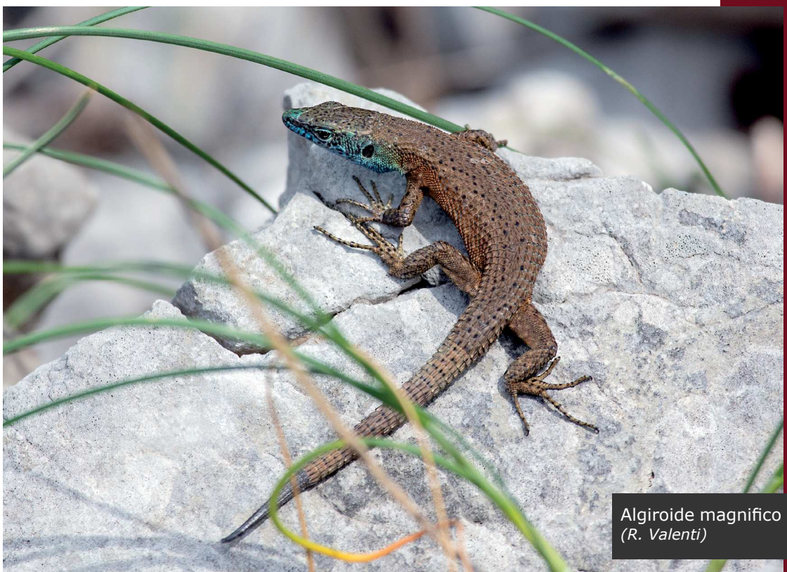
Algiroide magnifico (R. Valenti)

Variante. L’area della cima del Monte Sabotino si può raggiungere comodamente dalla Slovenia seguendo la strada per il rifugio.