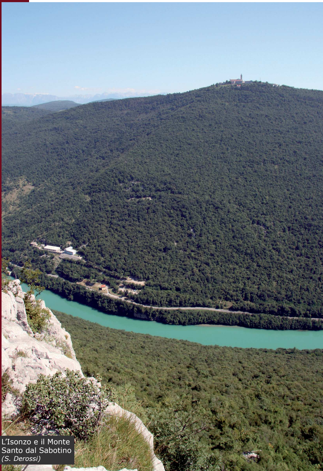
L'Isonzo e il Monte Santo dal Sabotino (S. Derossi)